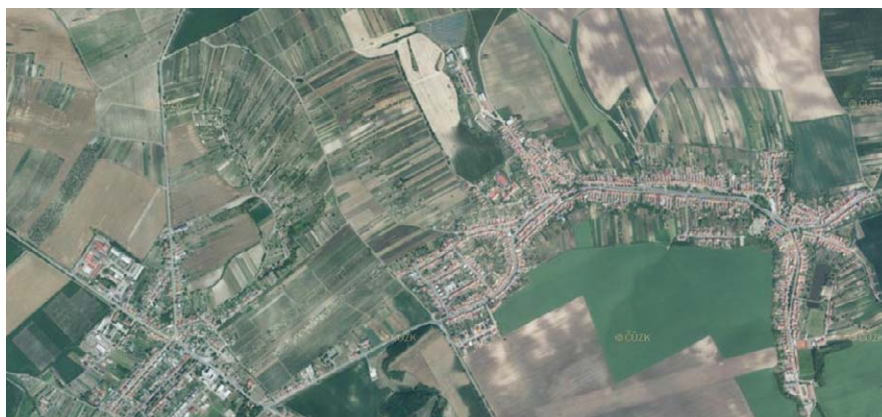
V přednáškách o vývoji české krajiny se rozebírají i změny v krajinném zrnu. Zde okolí Čejče, kde ještě můžeme najít i drobná polička.