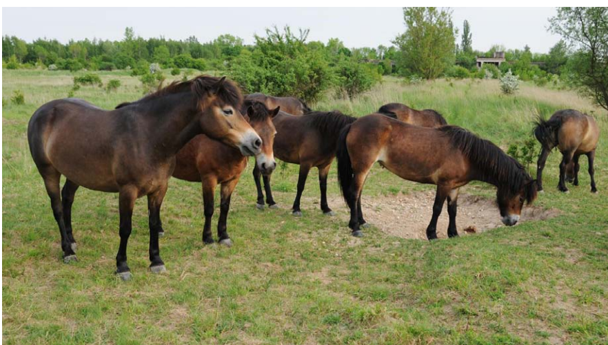
Jedním z témat kurzu o ochranářských managementech je využití velkých savců, které přednáší Miloň Jirků, jeden z autorů projektu v Milovicích.

Každý kurz bude trvat 12 týdnů. Týdenní přísun informací se bude skládat ze zhruba 1,5 hodin přednášek rozdělených do jednotlivých 10-20 minutových tematických bloků. Ty se budou skládat z power-pointové prezentace a slovního komentáře k ní. Na počátku každého bloku bude několik