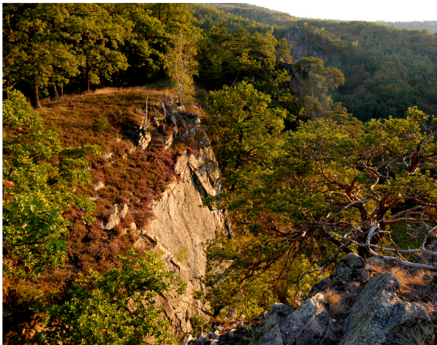
Speciální péče o skalnaté výchozy a drobné pleše na stráních kaňonu, která byla nastavena již prvním plánem péče, je v zájmu zachování biodiverzity aplikována dodnes.

také péči o rekreační, vzdělávací a osvětové využití území a organizaci terénní a strážní služby.