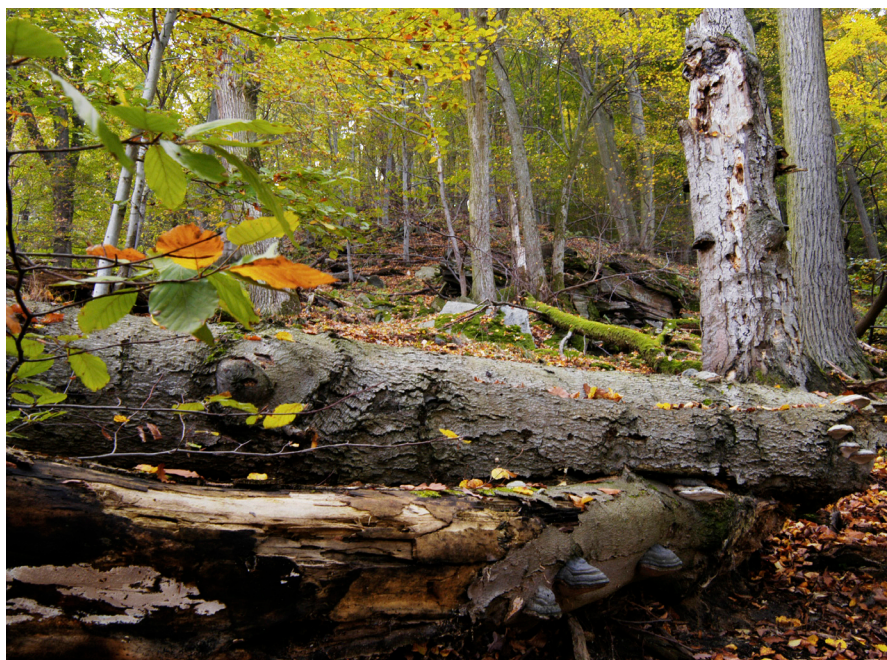
Lesní porosty s fungující přirozenou dynamikou rozpadu a obnovy zůstávají na většině území ponechány samovolnému vývoji.

národního parku. Nicméně na Podyjí se ukázalo, že tato kapitola může vyřešit i protichůdnost požadavků jednotlivých předmětů ochrany samotného národního parku. K předmětům ochrany Podyjí patří polopřirozená bezlesí a světlé lesní porosty, které jsou významným refugiem vzácných světlomilných druhů. Tyto biotopy bez lidských zásahů postupně zanikají. Předmětem ochrany národního parku jsou však i samovolné procesy, tedy vývoj biotopů bez lidského zásahu. Sladit péči o území národního parku tak, aby žádný z těchto dvou předmětů ochrany nebyl bezprostředně ohrožen na existenci, pomohla i výše zmíněná kapitola plánu péče. Její tvorba a také tvorba pasáže rozborové části plánu, v níž byla potřeba ochrany polopřirozených bezlesí popsána jako nově objevený problém, si vyžádala intenzivní spolupráci napříč jednotlivými odbornými pracovišti Správy NP. Výsledkem byl konsenzus na novém způsobu členění území, které bylo východiskem pro další specializovaná sledování vývoje biotopů a populací na ně vázaných druhů (motýli, světlomilné dřeviny apod.). Jejich výsledky pomáhají dále vybalancovat péči o území tak, aby byl zachován dostatečný prostor pro podporu přirozených procesů i pro zachování významných fenoménů vázaných na trvalou lidskou péči.