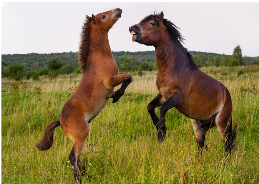
Hřebec divokých koní nacvičuje s hříbětem souboj.

Prosazení projektu jak v domácích, tak v zahraničních médiích ukázalo, že není důležité pracovat s absolutní novinkou a jedinečností, ale že velmi záleží na dobrém zvládnutí řemesla a zpracování, které dokáže přiblížit souvislosti, většinou dostatečně známé