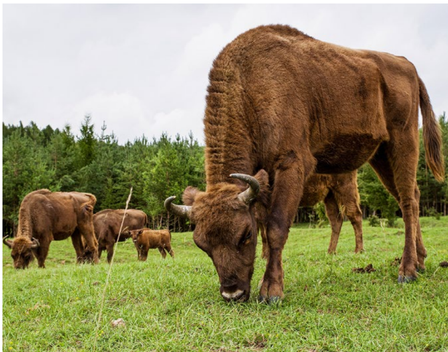
Do roku 2018 se stádo zubrů v bývalém vojenském prostoru Milovice rozrostlo na 21 jedinců.

Ani proniknutí do českých médií nebylo úplně jednoduché. Přestože jsou velcí kopytníci sami o sobě pro veřejnost atraktivní, ochrannářská organizace dlouho váhala, zda a jak téma prezentovat. Přeci jen, s velkými kopytníky v krajině chyběla veřejnosti v Česku zkušenost po mnoho staletí. Existovalo tak