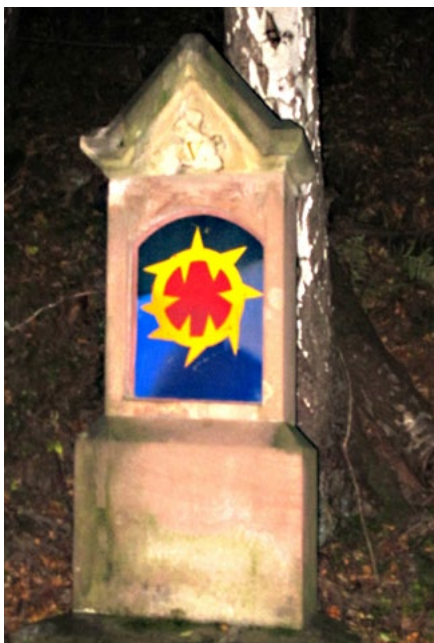
Příklady dobré praxe – Křížová cesta na Starou horu v Temném dole. Křížové cesty jsou příkladem skvělé interpretace. Jsou jednoduché, bez textu, mají silný příběh a provokují k přemýšlení. Takové by měly být naučné stezky.

prvek nestojí pár stokorun, ale mnoho párů tisícikorun. Tedy žádná dětská hřiště nebo tělocvična v Krkonoších dělat nebudeme. Herním prvkem může ale být i nějaký kvíz, skládačka a podobně. Lámat hlavu hlavolamem nám ještě nikdo nezakázal.