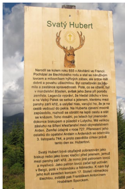
Příklady špatné praxe – stará infocedule z Naučné stezky Černoohorské rašelinisté. Psát o svatém Hubertovi v lese je v pořádku. Ale budme upřímní, budete se kochat fantastickým výhledem nebo čistě dobřemíněnýmáledlouhým text? A vůbec, kdo investoval svůj čas a peníze do tvorby této cedule?

Informační cedule by neměl dělat odborník na to, co cedule vysvětluje. Velmi často je přesvědčený o tom, že se o dané problema-