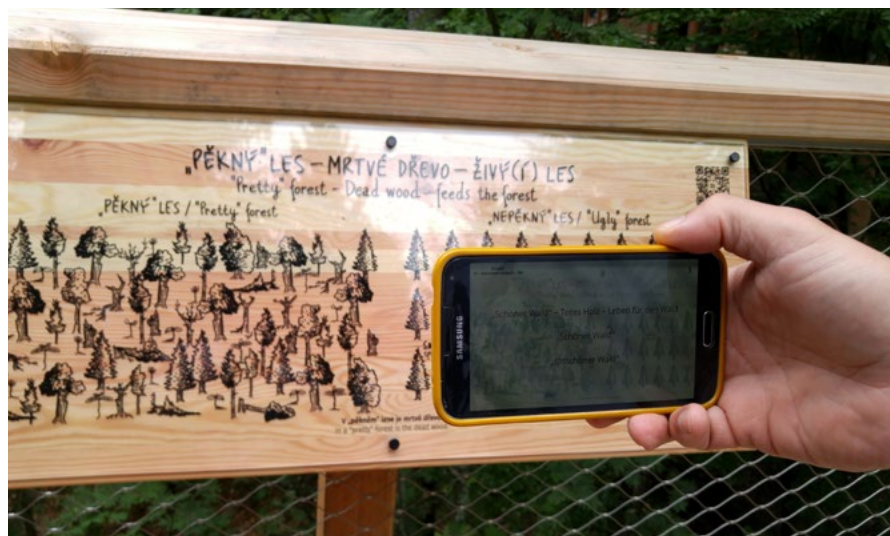
Příklady praxe – překládací aplikace. Na Stezce korunami stromů Krkonoše si můžete stáhnout malou apku. Když pak namíříte chytrý telefon na ceduli, automaticky vám ji přeloží do polštiny nebo němčiny, podle toho, jakým jazykem s ním mluvíte.

Jedna věc je udělat skoro dokonalou ceduli, která se autorovi (a lidem z vedlejší kanceláře, kde sídlí účtárna) líbí, druhá věc je, zda infocedule funguje. Zjistit přitažlivost informačních cedulí je jednoduché. Autor infocedule sežene nějakého studenta na praxi nebo stážistu, posadí ho na pařez vedle cedule a nechá ho počítat lidi, kteří kolem cedule prošli a ty, kteří si ceduli přečetli.