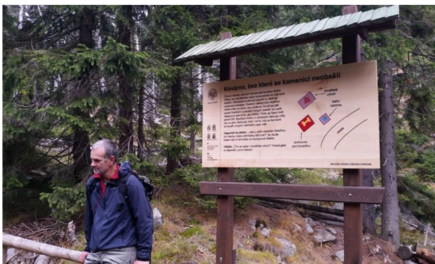
Příklady praxe – infocedule Správy KRNP. I když si pán na fotce ceduli nepřečetl, protože je Nor a cedule je jen v češtině, má cedule svůj význam. Deklaruje, že je tam někdo, komu záleží na návštěvnicích a něco pro ně dělá. Infocedule jsou dobrou i špatnou vizitkou zřizovatele.