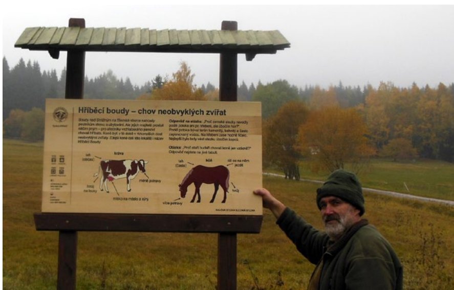
Příklady praxe – infocedule Správy KRNP. Do obrázku se vejde víc informací, než do textu. Obrázek může přitáhnout pozornost návštěvníka lépe, než text. Obrázek nepotřebuje překlad (popisky ano).

2014 zkoumali mimo jiné i přitažlivost 14 náhodně vybraných panelů v Jihomoravském kraji. Přitažlivost jihomoravských infocedulí byla 9,4 %. V letech 2016 až 2018 jsme stejnou metodikou testovali 25 infopanelů na krkonošských naučných stezkách. Průměrná přitažlivost krkonošských cedulí