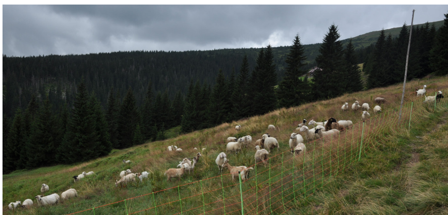
Pastva na Studničních Boudách.

pomohla zejména snadná kombinovatelnost plateb dotací Ministerstva zemědělství a programů z Ministerstva životního prostředí. Hlavní management na travních porostech, jako například pastva či seč, je možno plošně platit z agroenvironmentálních programů. Z vedlejších zdrojů pak může být připláceno za speciální opatření, která agroenvironmentální programy nepokrývají. Tato cesta však znamená vytvoření jasné metodiky pro možnost kombinace jednotlivých programů a titulů Ministerstva životního prostředí a Ministerstva zemědělství. A protože nás v roce 2015 čeká rozjezd nového Programu rozvoje venkova, budeme na této věci pracovat. Zároveň je nutné v rámci možností