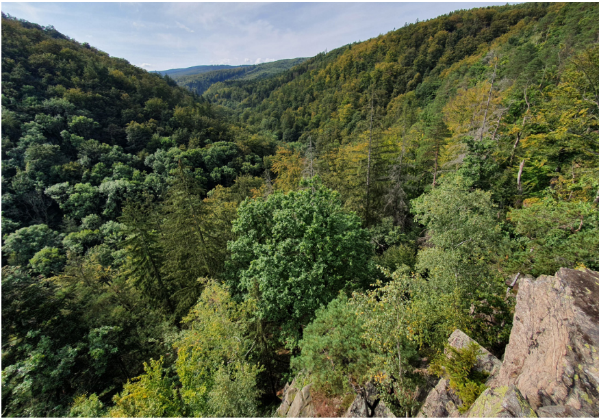
Mezi území s vysokou přírodní a krajinnou hodnotou, z hlediska ochrany evropsky významných lokalit se střední nálehavostí vyhlášené, byla zařazena tři území: Krušné hory, Rychlebské hory a Chřiby a Ždánický les. Na snímku rozsáhlé listnaté lesy v PR Račí údolí v Rychlebských horách.