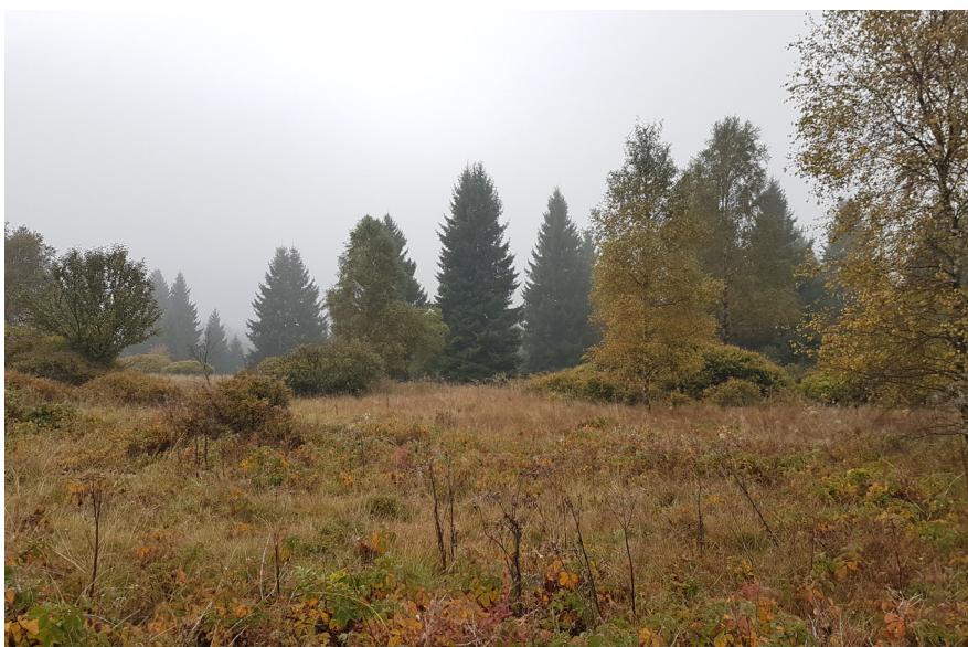
CHKO Český les byla v r. 2005 vyhlášena díky aktivitě krajského úřadu a podpoře obcí, kraje a členů Parlamentu ČR z tohoto kraje. Na snímku interiér NPP Na požárech v severní části CHKO.

krasová území, nivy řek, území s četnými významnými geomorfologickými jevy, významnými mokřady apod. Zastoupení přirozených ekosystémů na území CHKO zpravidla zřetelně převyšuje průměr vztahovaný k celé České republice. CHKO jsou jedinou kategorií zvláště chráněných území, kde předmětem ochrany je i krajinný ráz včetně zachovalých sídel, kulturních památek a charakteristicky uspořádaných hospodářských systémů (Miko a kol. 2005). Posláním CHKO je především uchování krajiny se všemi jejími přírodními hodnotami a kulturními charakteristikami jako výsledku společného a vyváženého působení přírodních sil a činnosti člověka. Přírodní hodnoty jsou v CHKO soustředěny převážně do prvních a druhých zón, často vyhlášených jako maloplošná zvláště chráněná území. Na většině území CHKO je účelem nejen ochrana těchto zachovalých částí přírodního prostředí, ale rovněž i rozvoj ekologicky vhodného a územně diferencovaného hospodářského a šetrného rekreačního využívání krajiny, zajišťujícího uchování místního přírodního a kulturního dědictví.