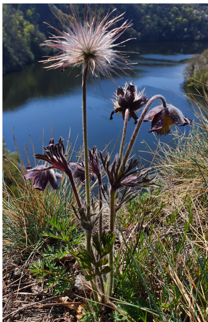
V projektu komplexního vyhodnocení potenciálu krajiny České republiky z hlediska možného dalšího územního rozvoje v chráněných krajinných oblastech ČR realizovaném v letech 2003-2004 bylo mezi území navržené k ochraně zařazeno také Střední Povltaví. Na fotografii záběr z NPR Drbákov - Albertovy skály.

Návrh nového zřizovacího předpisu CHKO Bílé Karpaty je v současnosti ve fázi zpracování prvních verzí nezbytných podkladů (vymezení hranice, vymezení zón, návrh předmětů ochrany a bližších ochranných podmínek). V závislosti na průběhu vyhlášení NP Křivoklátsko, jehož proces byl zahájen oznámením záměru dne 27. září 2022, bude připravováno také nové vyhlášení CHKO Křivoklátsko.