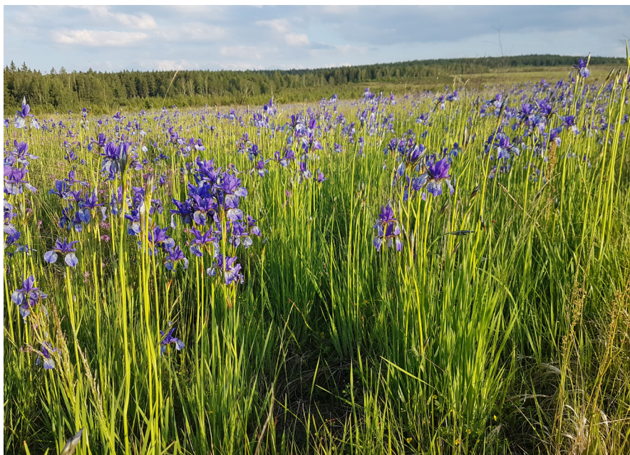
Územní ochrana Brd byla navrhována již před sto lety. Nicméně díky existenci vojenského újezdu nepatřila mezi priority ochrany přírody. Ke změně situace však došlo po zrušení újezdu. Všechny okolní obce i obě krajské samosprávy podporovaly rychlé vyhlášení CHKO na místě zrušeného újezdu a tak se jí podařilo v r. 2016 vyhlásit v rekordně krátkém termínu. Na fotografii porost kosatce sibiřského patřícího mezi ikonické organismy Brd.

CHKO jsou jednou z kategorií zvláště chráněných území. Zákon o ochraně přírody a krajiny definuje CHKO jako „rozsáhlá území s harmonicky utvářenou krajinou, charakteristicky vyvinutým reliéfem, významným podílem přirozených ekosystémů lesních a trvalých travních porostů, s hojným zastoupením dřevin, popřípadě s dochovanými památkami historického osídlení“. Za rozsáhlé území ve smyslu zákona se zpravidla uvažuje území větší než 80 km 2 , neboť „praktickou ochranu krajiny nelze zajistit v území menším než 40-50 km 2 “ (Miko a kol. 2005). Za harmonicky utvářenou krajinou s charakteristicky utvářeným reliéfem se považují zejména horské celky,